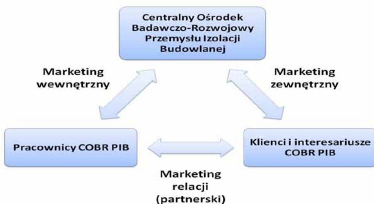
Rysunek 2. Wzajemne powiązania marketingu zewnętrznego, wewnętrznego i relacji.