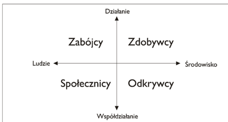
Rysunek 1. Rodzaje graczy według Bartle'a. 11

Większość graczy przejawia wszystkie powyższe typy zachowań równocześnie z jednym lub dwoma o charakterze dominującym. Projektując grę lub system grywalizujący należy wziąć pod uwagę motywacje każdego z typów, aby pozyskać ich dla gry i skłonić do większego wysiłku i zaangażowania.