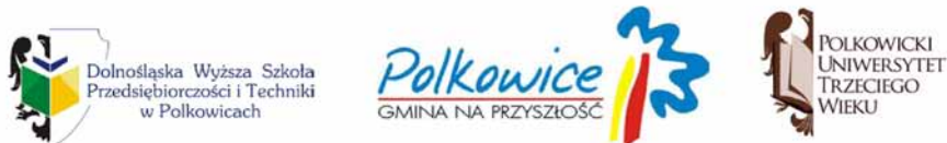
Rysunek 1. Logotypy: Dolnośląskiej Wyższej Szkoły Przedsiębiorczości i Techniki w Polkowicach, Polkowic oraz Polkowickiego Uniwersytetu Trzeciego Wieku.