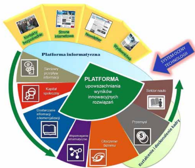
Rysunek 1. Struktura organizacyjna modelowej platformy technologicznej.