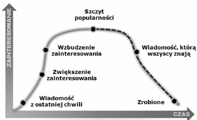
Rysunek 1. Rozkład normalny zainteresowania przekazem.